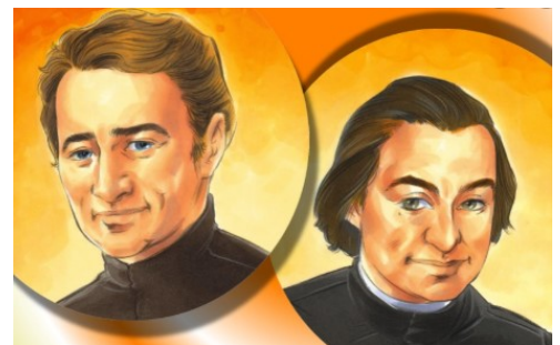
JEAN-MARIE DE LA MENNAIS